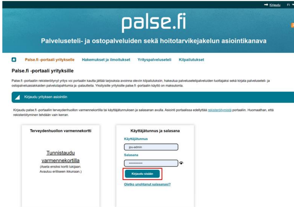
Kuva 2 Käyttäjätunnus ja salasana

Seuraavaksi kirjoita Käyttäjätunnus sekä Salasana ja klikkaa Kirjaudu sisään -painiketta.