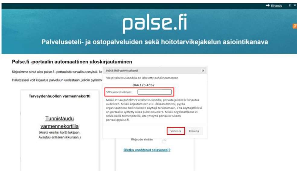
Kuva 3 SMS-vahvistuskoodi

Tehtyäsi edellisen, saat vahvistuskoodin puhelimeesi, jonka syöttämällä SMS-vahvistuskoodi -kenttään ja klikkaamalla Vahvista , pääset kirjautumaan palse.fi-portaaliin sisään.