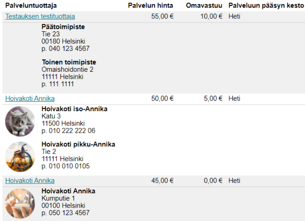
Kuva 6 Hinnastoluettelo

Toimipisteiden tiedot on siirretty vasempaan laitaan ja toimipisteen kohdalla näytetään kuva, jos sellainen on lisätty toimipisteen tietoihin.